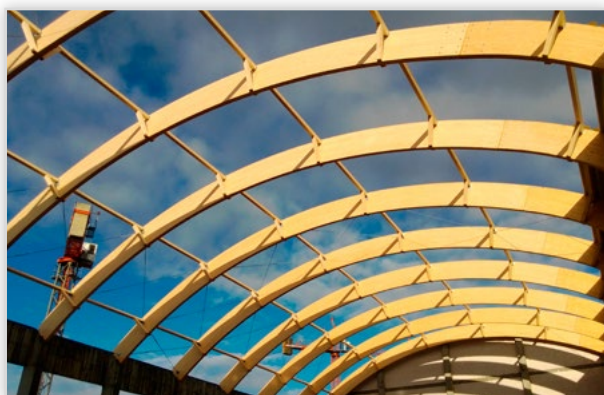
Lilleheden, Hala sportowa - Kosakowo