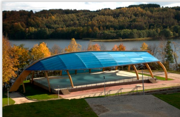
Lilleheden, Amfiteatr - Brodnica Górna