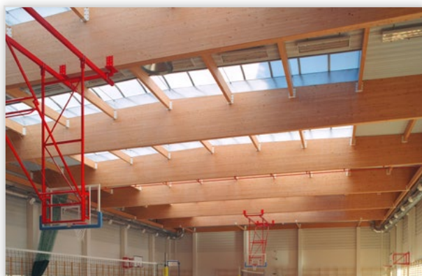
Lilleheden, Sala sportowa - Wałbrzych