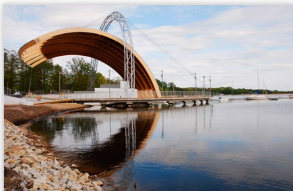
Lilleheden, Scena letnia - Miedwie